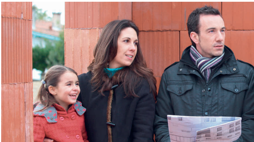
Fällt der Eigenmietwert oder nicht? Die Diskussion ist noch im Gang.

Steuerabzüge (Hypothekarzinsen, Unterhaltskosten u. a.) ebenfalls erhalten bleiben sollen. Im Nationalrat wurde rasch klar, dass der Ansatz, «den Fünfer und das Weggli» zu wollen, nicht mehrheitsfähig ist. Nun geht das Geschäft zurück an die Kommission. Mit raschen Änderungen in Sachen Eigenmietwert ist also vorderhand nicht zu rechnen. ■